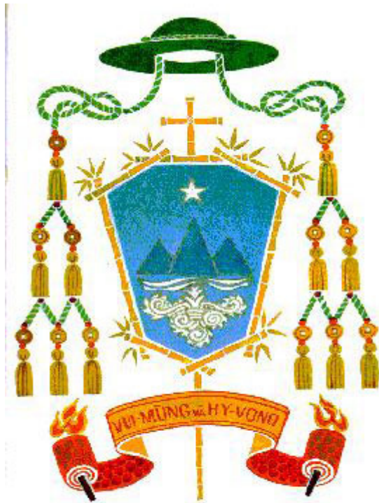
Khẩu hiệu Giám Mục của ĐHY Nguyễn Văn Thuận, tên một Hiến Chế của Công Đồng Vatican II: "Vui Mừng và Hy Vọng".